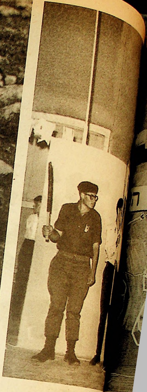
עצמאות, תיך דאשוט, מן יצובים, ש יורה פלי נברו השג